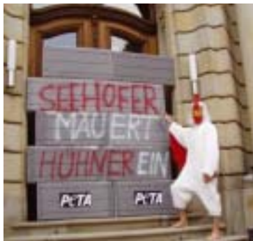
Protest vor Seehofer-Ministerium

Am 18. April 2007 wurde der 10. Tierschutzbericht der Bundesregierung beschlossen. Landwirtschaftsminister Horst Seehofer lobte: »Deutschland hat auf dem Weg zum tiergerecht wirtschaftenden Agrarstandort einen wichtigen Schritt getan. Auf vielen Gebieten, so z.B. für die Pelztiere und im Bereich der Tiertransporte, konnten entscheidende, tiergerechte Fortschritte erzielt werden.« - Hört sich gut an. Doch was ist hier Dichtung und was ist Wahrheit?