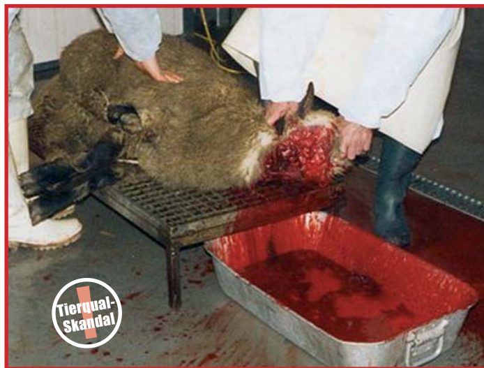
Laut Umfragen sind 79% (!) der Bevölkerung gegen die entsetzliche Tierquälerei des betäubungslosen Schächt-Schlachtens per »Sondergenehmigung«.

Es wird hier keine Ruhe geben. Tierschutz, der das Grauen des betäubungslosen Schächtens ausklammert, ist kein Tierschutz.