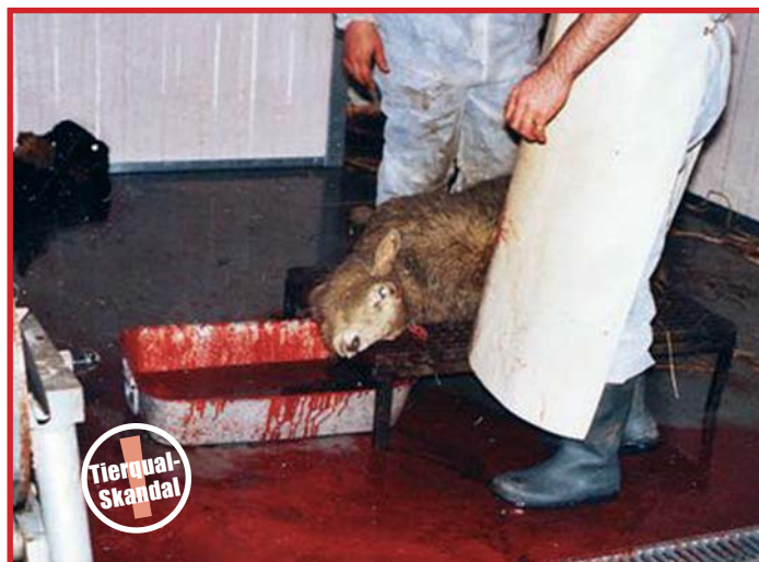
Eine Praktik, Tiere unbetäubt abzumetzeln, steht konträr dem als Staatsziel in der Verfassung verankerten Tierschutz entgegen. Schreiben auch Sie an unsere »Volksvertreter«. Teilen Sie ihnen unmissverständlich mit, wie sie Politiker bewerten, die ihre schützende Hand über die anachronistische entsetzliche Tier-schinderei »betäubungsloses Schächten« halten.

Informationen: Arbeitskreis für humanen Tierschutz und gegen Tierversuche e.V.