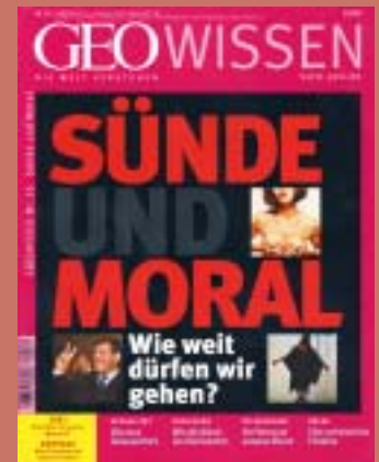
GEO WISSEN Nr. 35: Sünde und Moral (2005)