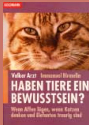
Arzt/Birmelin: Haben Tiere ein Bewusstsein? Goldmann, 1995