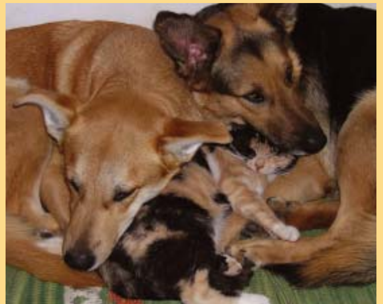
Freundschaft über Artgrenzen hinweg

Viele Philosophen und Biologen trauten jahrhundertlang nur dem Menschen als »Krone der Schöpfung« zu, Recht von Unrecht zu unterscheiden und seine Handlungen nach ethischen Regeln auszurichten. Tiere galten bislang als »animalisch«, »viehisch«, »bestialisch« und »tierisch«. Doch in unsrer Zeit stoßen Forscher zunehmend auf »humane« Umgangsformen bei Tieren wie Einfühlung, Mitgefühl, Hilfsbereitschaft, Selbstlosigkeit, Opferbereitschaft, Gerechtigkeit, Freundschaft, Gemeinschaftssinn, Fairness, Versöhnung.