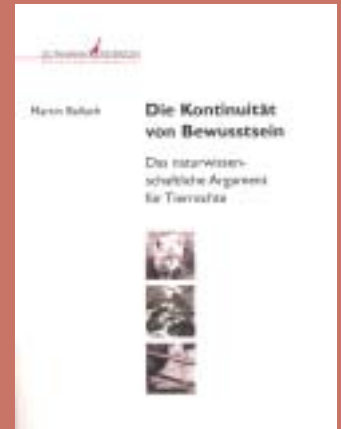
Martin Balluch: Die Kontinuität von Bewusstsein. Guthmann/Peterson, 2005