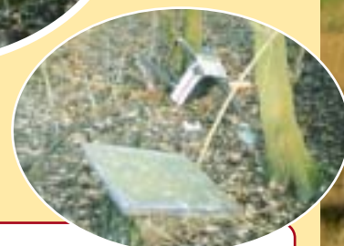
Bild unten: Jägermüll, Teile eines alten Hochsitzes und von Fütterungen liegen im Wäldchen rum