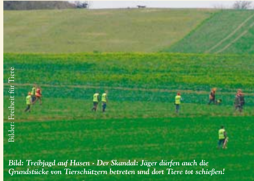
Bilder: Freiheit für Tiere

Frau H. berichtet: »Ich kam vormittags vom Einkaufen nach Hause, als ich ca. 350m vorm Haus einige Jäger und Treiber sah. Ich hielt an, um ihnen zu sagen, dass auf unse-