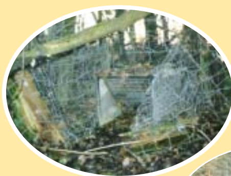
Bild links: eine sog. Drahtfalle

Diese Bilder zeigen, wie sich Jäger fremder Grundstücke bemächtigen - ohne Einholen von Genehmigungen der Eigentümer: Dem Eigentümer von Gut Eilen gehört ein kleines Wäldchen, in dem diverse Fallen und Hochsitze aufgestellt wurden. Auch wurden ca. 50 qm Fichten ohne weiteres Nachfragen dort angepflanzt. Die Arbeit, den Unrat zu entsorgen, kann dann der Eigentümer übernehmen...