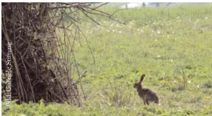
Gehölzschnitt und Hecken bieten Schutz für Anpflanzungen, gleichzeitig Nistmöglichkeiten für Vögel und Lebensraum für viele Tiere